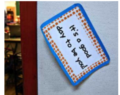
EN GOD DAG: Hvorfor ikke på en lørdag?