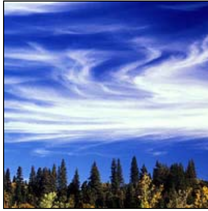
Saçak bulutlar (Sirrüs) Cirrus, Ci