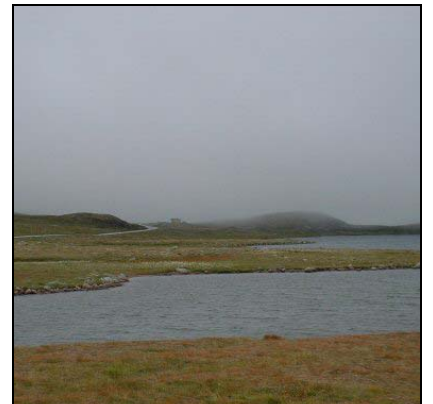
Katman bulutlar (Stratüs) Stratus, St