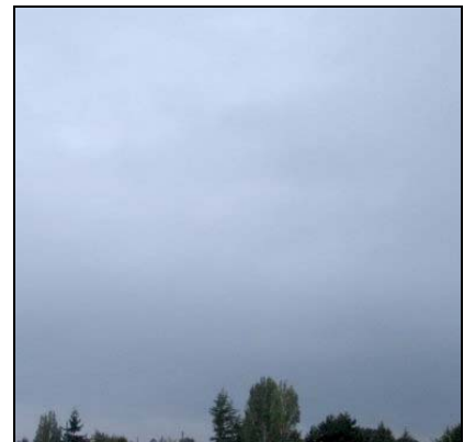
Kara bulutlar (Nimbüstratus) Nimbostratus, Ns

Kilde: www.victoriaweather.ca http://asd-www.larc.nasa.gov/SCOOOL