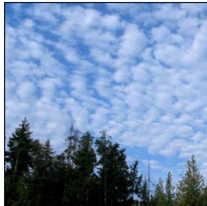
Yığın bulutlar (Stratokümüülüs) Stratocumulus, Sc