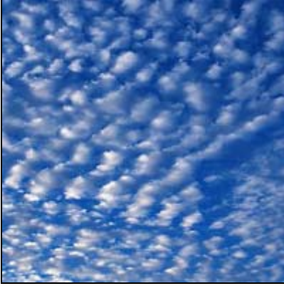
Kara bulutlar (Altokümüülüs) Altocumulus, Ac