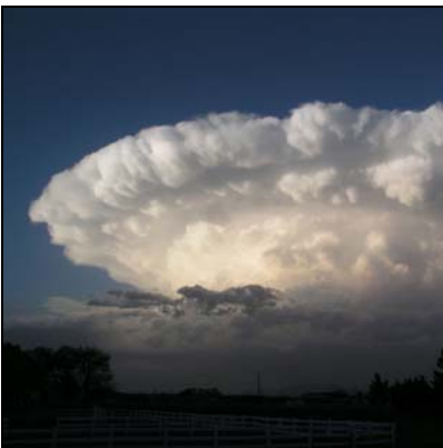
Boran bulutlar (Kümülonimbus) Cumulonimbus, Cb