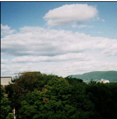
Küme bulutlar (Kümüülüs) Cumulus, Cu