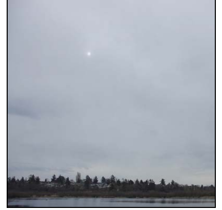
Üst Katman bulutlar (Altostratüs) Altostratus, As