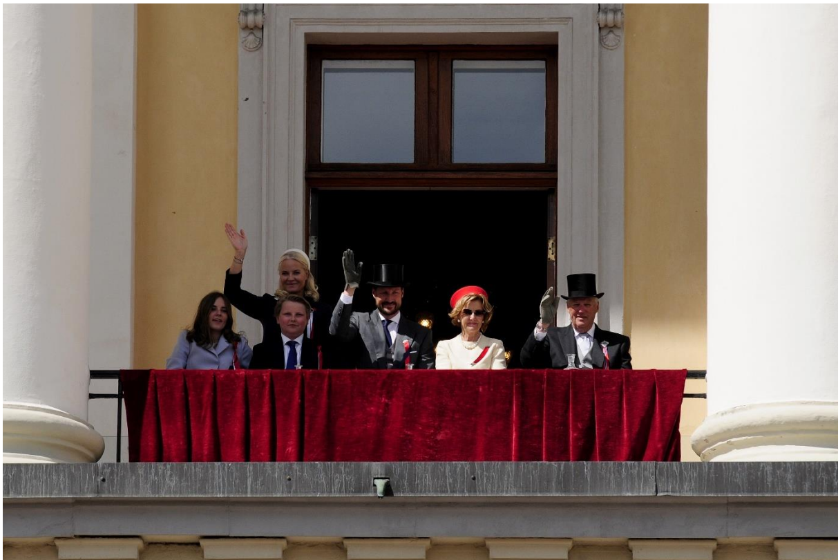
Kongefamilien vinker til barnetoget i Oslo. Fra venstre: prinsesse Ingrid Alexandra, prins Sverre Magnus, kronprinsesse Mette Marit, kronprins Haakon, dronning Sonja og kong Harald

د خلکو مارشونه د ماني (قصر) له لارې تیرېږي او ټول ماشومان او ښوونکي شاهي کورنۍ ته لاس خوځوي. شاهي کورنۍ هم بیرته د هرکلي لاس خوځوي. په اسلو کې تر سلو ډیر ښوونځي په مارش کې برخه اخلي.