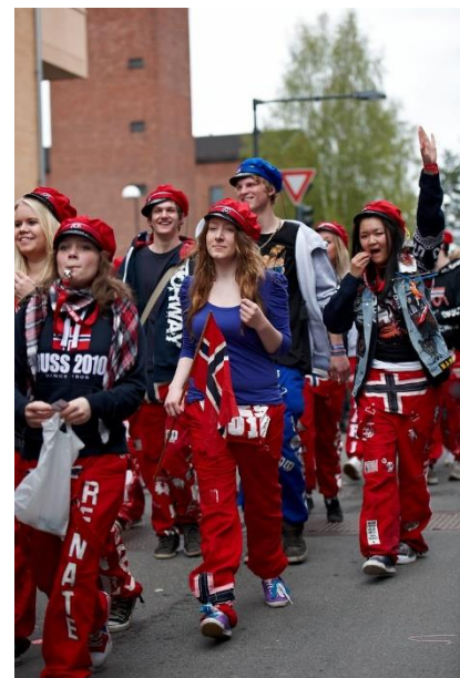
Blåruss og rødruss

همدا رنگه د می 17 د ماشومانو ورځ هم ويل کيږي. په ټول هيواد کې، د ښوونځيو ماشومان مارش کوي ، بيرغونه رپوي ، خوشحالي کوي او سندرې وايي. د ميوزیک باندونه موسيقي غږوي. پدغه ورځ ډيری خلک ملي سرود غږوي" هو ، مور مينه لرو". ددغه ملي سرود متن(Bjørnson Bjørnstjerne) په کال 1859 کې وويل. په کال 1863 کې د هغه خوريي Nordraak Rikard دغه ملي سرود وغږوله او تنظيم کړه.