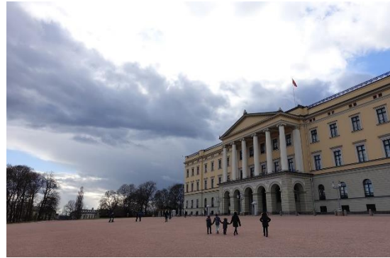
Det norske slottet.