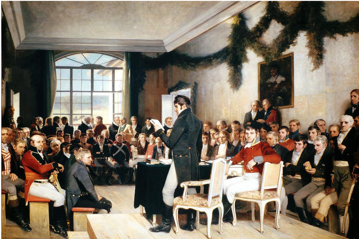
Maleriet heter Eidsvold 1814 og er malt av Oscar Wergeland.

په 1814 عیسوی کال کې، 112 نارینه د ناروي اساسي قانون لیکلو لپاره په ایډسول کې راټول شوي وو. په دغه غونډه کې خلک له بیلابیلو ځایونو څخه راغلي وه. دا ډله له نارینه ناروېژیانو څخه جوړه شوې وو چې ملي شورا نومېده او دوی شپږ اونۍ د اساسي قانون په لیکلو کې تیر کړل. د می په 17، اساسي قانون جوړ او د پاچا کریستیان فریدریک له خوا توشیح کړای شو. او له همدې امله دا هغه ورځ ده چې د ناروي ملي ورځ نومېږي.