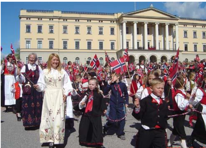
Barnetoget i Oslo foran slottet. Kan du se kongefamilien på balkongen?