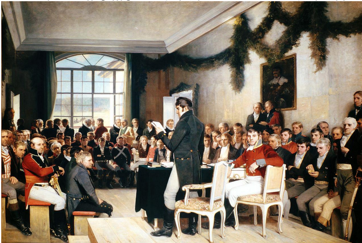
اسم نقاشی اید سوال ۱۸۱۴ است توسط اسکار ویگر لاند نقاشی شده است

در سال ۱۸۱۴ بود که ۱۱۲ مرد با هم جمع شدند تا قانون اساسی ناروی را بنویسند. آنها از مناطق مختلف ناروی آمده بودند که به نام گروهی دولت یاد میشدند و در ظرف شش هفته قانون اساسی را نوشتند و در ۱۷ می قانون اساسی تکمیل شد و توسط شاه فردریک کریستیان Fredrik Kristiania به امضا رسید. و همین سبب ۱۷ می روز ملی ناروی نامیده میشود.